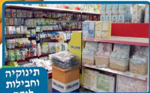
תינוקות וחבילות לידה