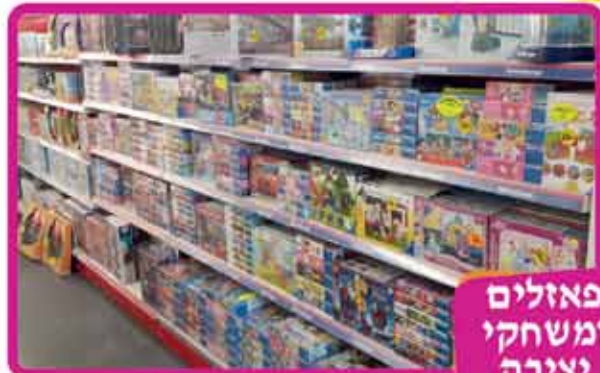
פאזלים ומשחקי יצירה