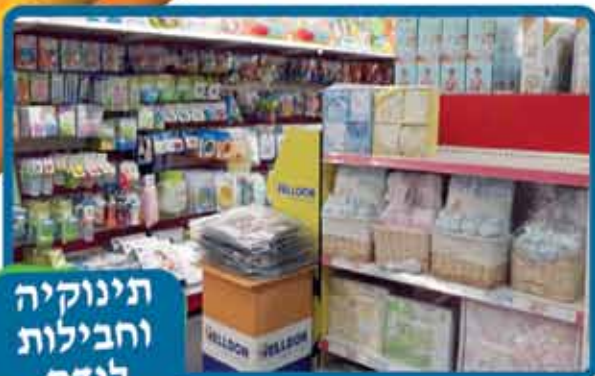
תינוקיה וחבילות לידה