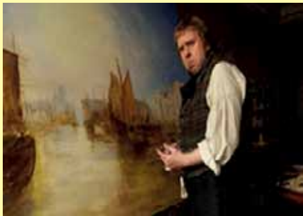
השחקן הנפלא טימותי ספול בתפקיד הצייר טרנר

חלק גדול מחייו בטבע, בין דייגים וספינים וניסה לתרגם את מה שראה, בעזרת אפקטים של אור וצבע, לציורים הנפלאים שממלאים, עד היום, מוזיאונים וגלריות בכל העולם. הוא היה צייר מוערך עוד בחייו והשפיע על אמנים שחיו אחריו. לטעמי - זהו סרט חובה.