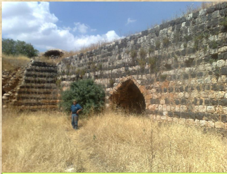
האגף הדרומי מימין וחצר החאן

על פי המקורות ההיסטוריים החאן עובר הליך של הזנחה מזה למעלה ממאתיים שנה. המקום נטוש ואינו מתוחזק על ידי גורם מקומי או ממלכתי. הקרקע בתחומה נמצא החאן בבעלות המדינה ומנוהלת על ידי רשות מקרקעי ישראל. לפני שנים אחדות ניסה מכון ישראלי לארכיאולוגיה (ע"ר) לעניין גורמי תיירות שונים