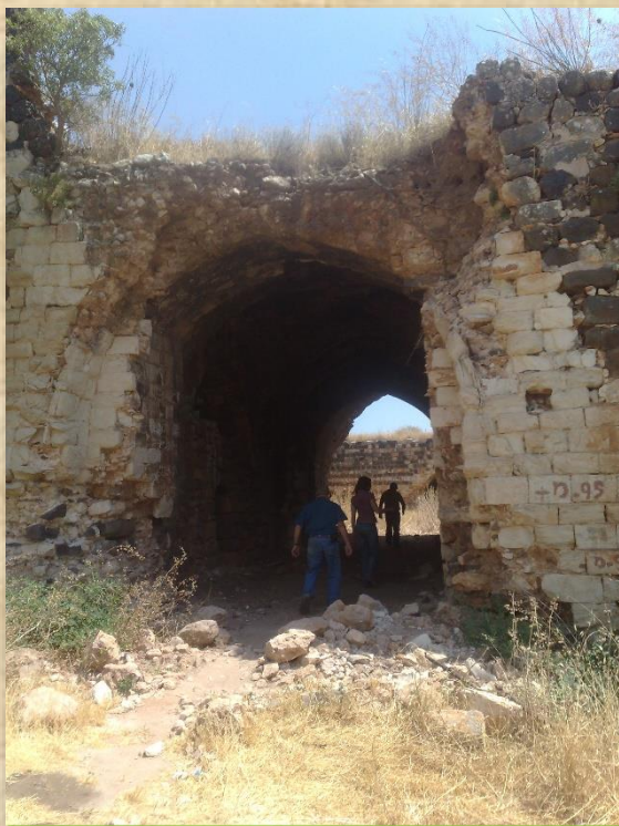
שער החאן באגף הצפוני. מבט דרומה לכיוון החצר

באפשרות לשקם את החאן ולהפעילו כמלון בוטיק. הכוונה הייתה להכשיר את החללים של החאן כמרחבים ציבוריים הפתוחים לקהל הרחב ואילו את חדרי המלון לבנות בסמוך לחאן בסגנון אדריכלי שיתאים למראה המקורי של החאן.