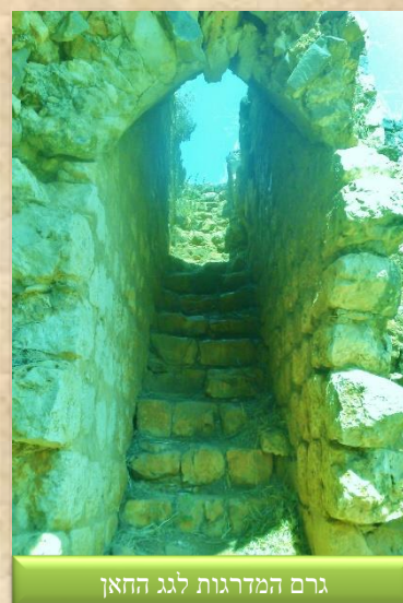
גרם המדרגות לגג הח'אן

המים וזיהום שלהם. עומקו של בור המים לא ברור לחלוטין, אך ניתן להעריך שהקיבולת שלו הייתה למעלה מ-130 קוב מים. בהתייחס לכך שצריכת המים בחברות מסורתיות הייתה צנועה מאוד, בור כזה היה יכול לספק את צרכי המים של