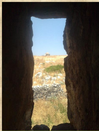
כיפת בור יוסף ניבטת מחלון מגדל הח'אן