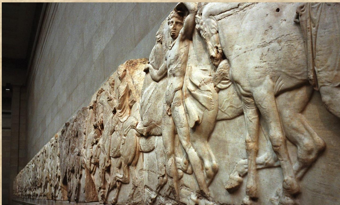
תבליטי השיש מהפרתנון המוצגים כיום במוזיאון האקרופוליס לאחר שהושבו ליוון מהמוזיאון הבריטי

המדינות המחזיקות באוצרות מיוון להשיבן אליה, אך הצלחתה הייתה חלקית בלבד. המדינה הראשונה שאמצה מודל לפיו יש להשיב לארץ המוצא עתיקות שהועברו לארץ אחרת, הייתה, למרבה הפליאה, ישראל אשר השיבה לרשות המצרים, בשנות ה-90, אלפי פרטי עתיקות שנחשפו בחפירות בסיני, כחלק מהסכם השלום עם מצרים. פעולה זו נעשתה בקול ענות חלושה ולא זכתה כמעט לתהודה בין-לאומית.