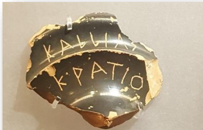
אוסטרקון הצבעה לגירוש של קליאס הבן של קראטיאס משנת 485 לפסה"נ. נמצא באתר קרמיקוס מוצג במוזיאון בנאקי - אתונה

הרצאה 1: 6.11.19 - עיר, הר וים - הרצאת מבוא, המציגה את התנאים הגיאוגרפיים של אתונה ואת ההקשרים ההיסטוריים והמרחביים לצמיחתה. לא ניתן לנתק את ההיסטוריה מהגיאוגרפיה ומהאקלים, המשפיעים באופן עמוק על החברה ועל הכלכלה. הרצאת המבוא תבחן את הנתונים הגיאוגרפיים של אתונה בפרט ושל מרחב הים האגאי בכלל, כמו גם את ההקשרים ההיסטוריים של התרבויות הים תיכוניות הקדומות.