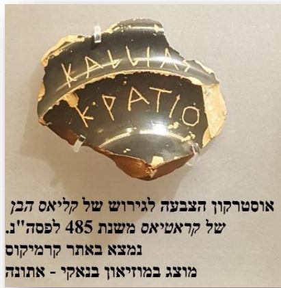
אוסטרקון הצבעה לגירוש של קליאס הבן של קראטיאס משנת 485 לפסה"נ. נמצא באתר קרמיקוס מוצג במוזיאון בנאקי - אתונה

הרצאה 4: 18.12.19 - הדמוקרטיה האתונאית - ההרצאה תבחן את לידתה של הדמוקרטיה באתונה ואת השלבים שהביאו להתפתחותו של "שלטון העם" בעיר. נדון בפועלם של קלייסטנס ופריקלס ונבחן מהי בדיוק דמוקרטיה בנוסח