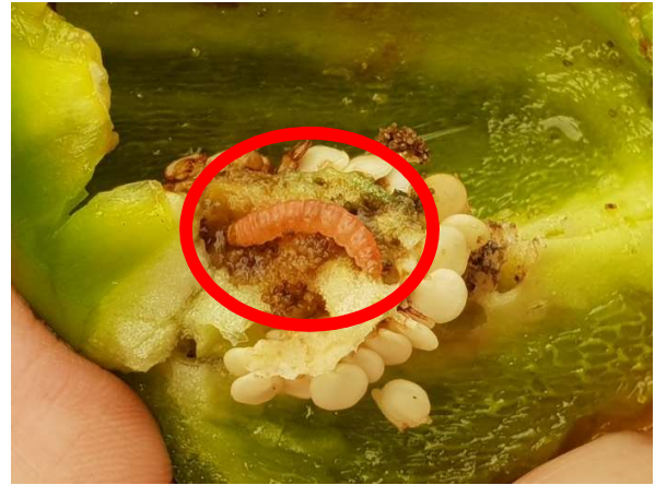
זחלי העש בצבע ורדרד (מימין), ולבנבן (משמאל)