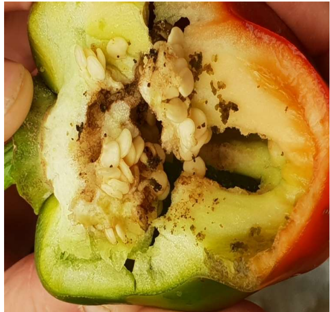
סימני כרסום, זחל בהיר וגללים בתוך הפרי