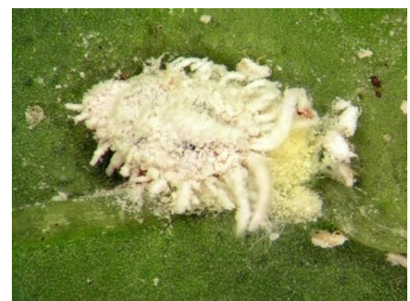
הכנימה וצבר ביצים