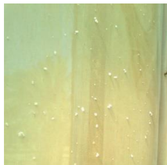
קמחיות על חוטי הדליה ועל הרשת