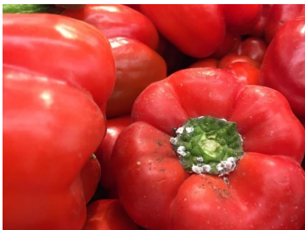
קמחיות על פרי הפלפל ברשתות השיווק

הכנימה מתיישבת על כל חלקי הצמח: שורשים, גבעולים, עלים ופירות. הנזק מתבטא בניוון אברי הצמח ובהפרשת טל-דבש המשמש מצע להתפתחות פטריות ה"פייחת". הנזק לפרי מתבטא בפירות דביקים המכוסים ב"פייחת", ולעתים בפרי המזוהם בקמחיות עצמן. פירות כאלה אינם ראויים לשיווק. פעילות הכנימה מתחילה במוקדים, כמו פינה מסוימת במבנה, ומהם היא מתפשטת לכל בית הצמיחה. הנקבות הבוגרות שורדות היטב בקרקע, גם בטמפרטורות הקיץ הגבוהות, במבנה, על שאריות צמחים או על שורשים בקרקע.