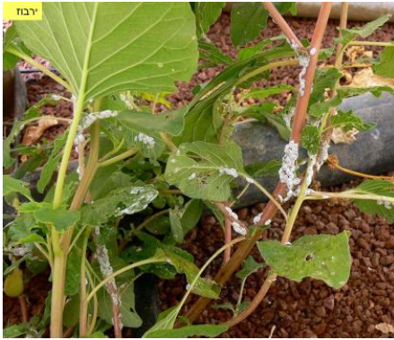
קמחית על ירבוז בחממת פלפל

למרחקים קצרים נעות הקמחיות בהליכה, ולמרחקים גדולים נישאים הזחלנים בזרמי האוויר והמים או על ידי נמלים וציפורים. נראה כי כושר התנועה של הקמחית המנוקדת גבוה במיוחד, והיא נצפית על קירות הרשת של המבנה, כשביכולתה לחזור בכוחות עצמה לתוכו. בנוסף לכך, תפוצת המזיק נעשית גם באמצעות שתילים וחומר ריבוי, פועלים וכלי עבודה.