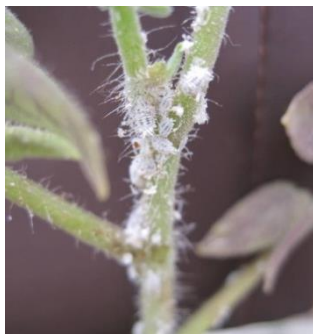
על שתיל של עגבנייה בחממה