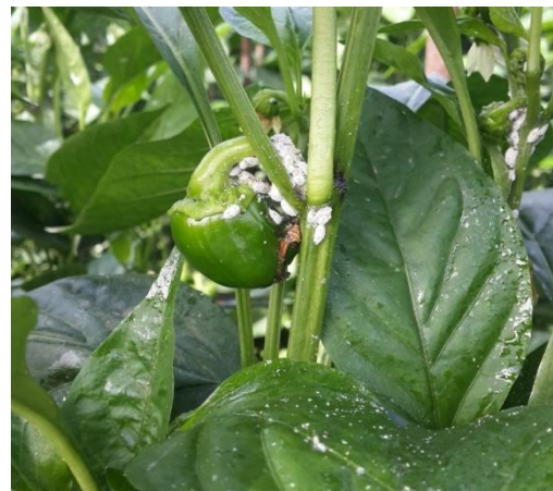
מקבץ קמחיות באזור החיבור של הפרי לגבעול