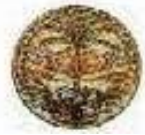
מנהל המחקר החקלאי מכון וולקני