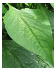
תמונה 3 ו-4. סימני מחסור במנגן