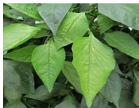
תמונה 1. סימני מחסור עקב נגיעות בנמטודות