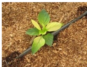
תמונה 2. סימני מחסור בברזל