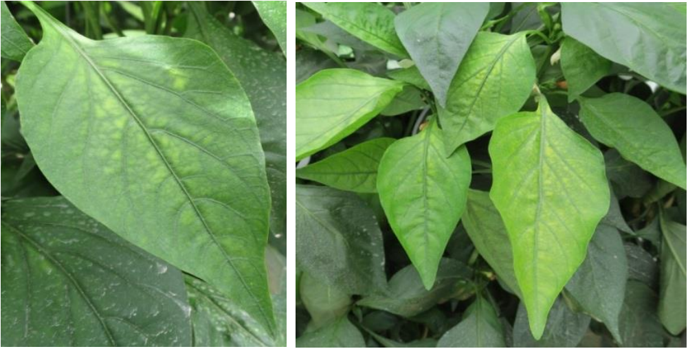
תמונות 3 ו-4. סימני מחסור במנגן