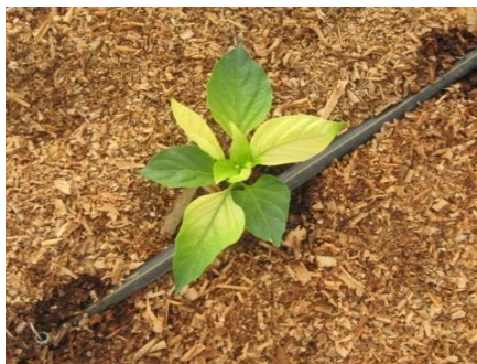
תמונה 2 . סימני מחסור בברזל

לעתים נראים סימני מחסור בעלים, כמו הצהבת עלים. בחלק מהמקרים נובעת התופעה מפגיעה בקליטת יסודות הקורט (בעיקר ברזל ומנגן) (תמונות 2, 3 ו-4), אך לעתים נראים הסימנים כמחסור, כתוצאה מנוכחות נמטודות (תמונה 1). בנושא הדברת הנמטודות יש להיוועץ במדריכי הגנת הצומח. במקרים אחרים נובע המחסור מעודפי מים או מ-pH גבוה. ניתן לתקן החסר ביסודות הקורט באמצעות יישום משולב של כילאטי ברזל ומנגן בכמות של חצי ק"ג לדונם סקוורטריין (או דומיו) וקורטין מנגן בכמות של 1-1.5 ליטר לדונם בטיפול חד-פעמי.