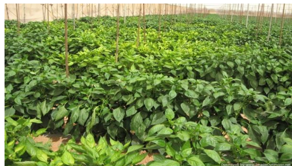
תמונה 1 . סימני מחסור עקב נגיעות בנמטודות