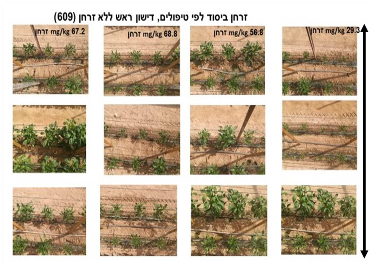
תמונה 1. השוואת התפתחות השתילים ברמות הולכות ועולות של זרחן ביסוד; מימין: הרמה הנמוכה, משמאל: הרמה הגבוהה

בתמונה מס' 1 המופיעה בהמשך מרוכזות תמונות של 3 חלקות/חזרות של אותו טיפול לאחר 40 יום מהשתילה כשרמות הזרחן לפי אולסן בקרקע הולכות ועולות בטיפולים שבהם לא ניתן דישון בזרחן בראש ולא בוצעה העשרה במיקוריזה במשתלה.