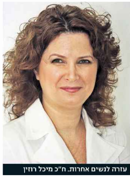
עזרה לנשים אחרות. ח"כ מיכל רוזין