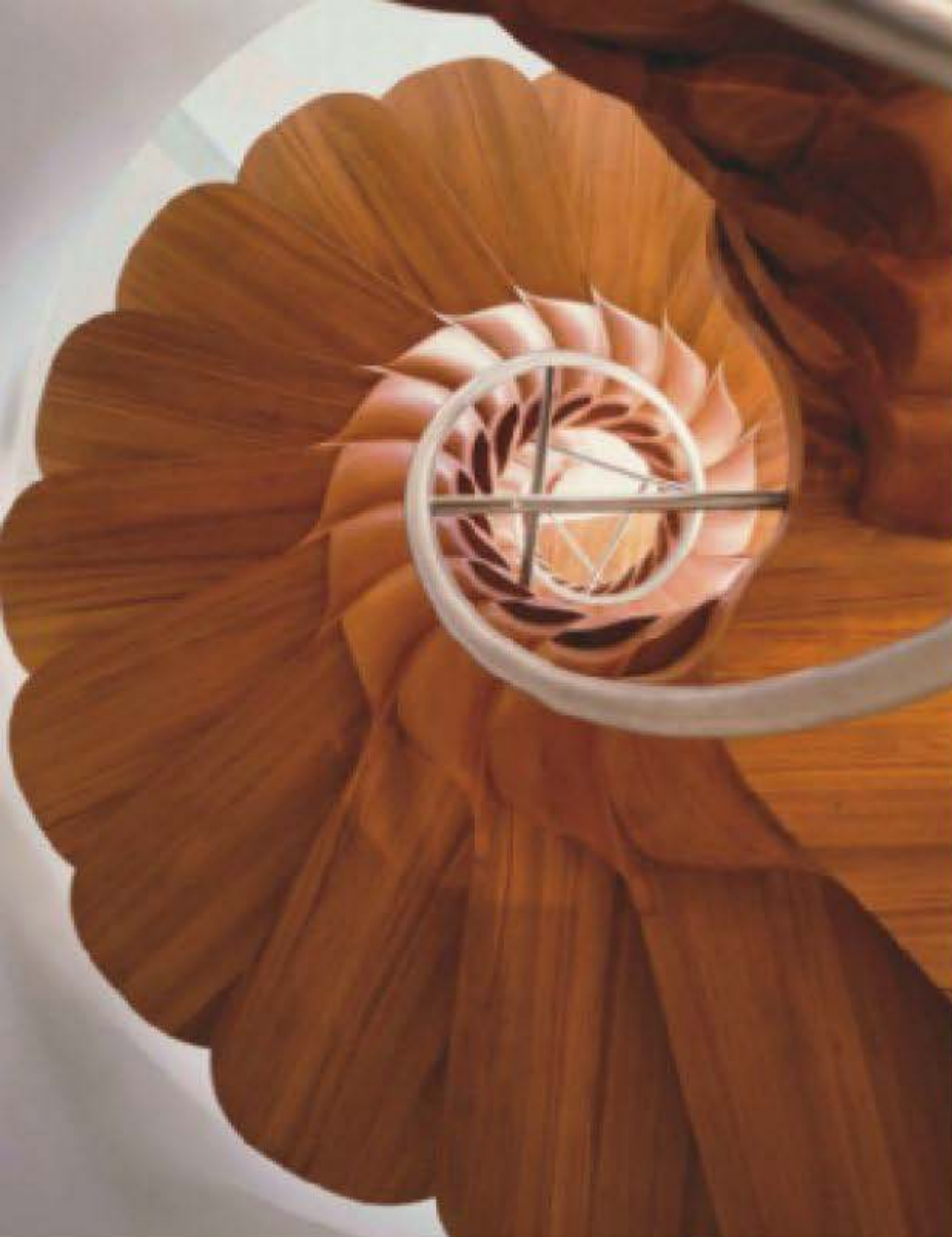
אדריכלות: Jouin Manku

נעטף בחוטי ראטאן, שכמו נשפכים לעבר המפלס התחתון ומאזנים בין הניגודיות שבחלל.