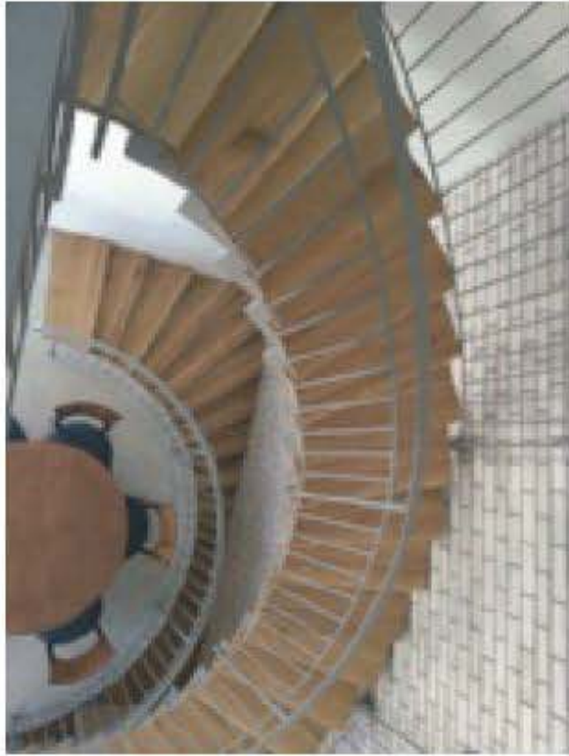
מימין: אדריכלות: דרור ברדה משמאל: אדריכלות: מרטין-קסל אדריכליות למטה: אדריכלות: קורין לוי