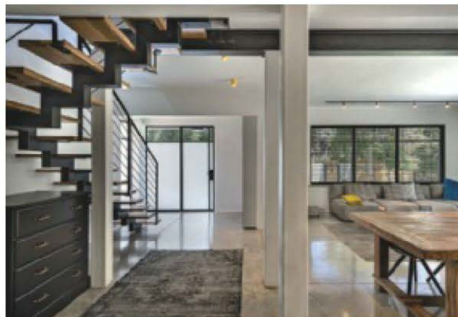
מימין: עיצוב פנים: ניצן הורוביץ משמאל: אדריכלות: וויט אדריכלים