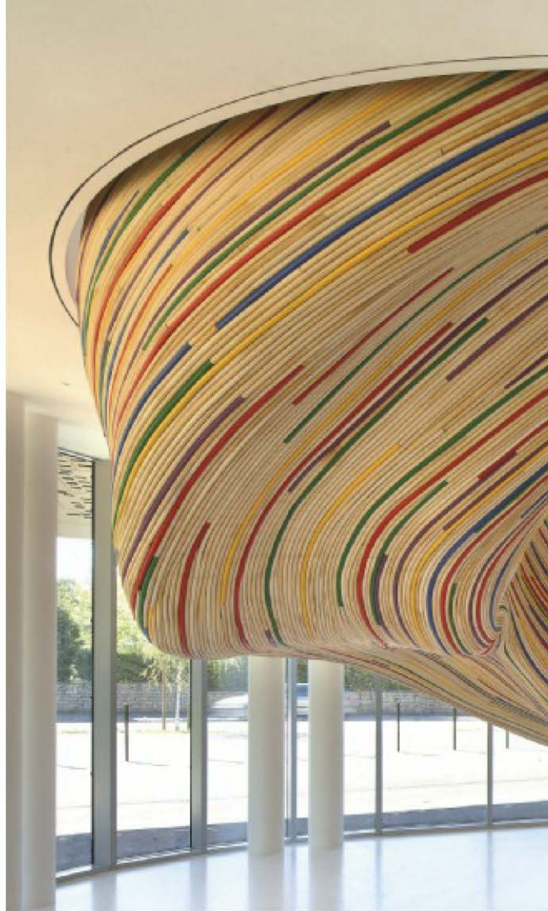
אדריכלות: Tetrarc Architects

גרם בעל נוכחות כובשת ומרשימה נבנה בכניסה לבית ספר לאומנויות בצרפת. המדרגות מקשרות בין מסדרונות בית הספר ואולם הריקוד בקומת הקרקע לבין חלל התערוכות בקומה השנייה. הקשר בין הקומות הפך למוקד המרכזי, כשעל רקע קירות צחים ומפתחי אור גדולים הועמד גרם מדרגות שנראה כמערכולת של צבעים וחומרים. המדרכים נותרו לבנים, אולם המבנה