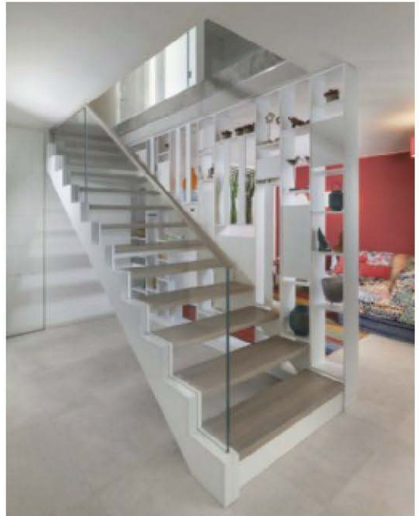
עיצוב פנים: אנט פרומר. ספרייה: "דומיסיל"

במקרה אחר ביקשה הדיירת לממש את חלומה למדרגות אליפטיות גדולות, ואכן הבית שתכננו במשרד "מרטין קסל אדריכליות" סובב כולו סביב המדרגות. "ידענו שזה ממש לא חלום, אלא פרט שיכול להתגשם", אומרת ענבל מרטין, "כל תכנון הבית נעשה כשבמרכז המדרגות כפסל בחלל. הן עשויות ברזל, המדרכים עשויות עץ,