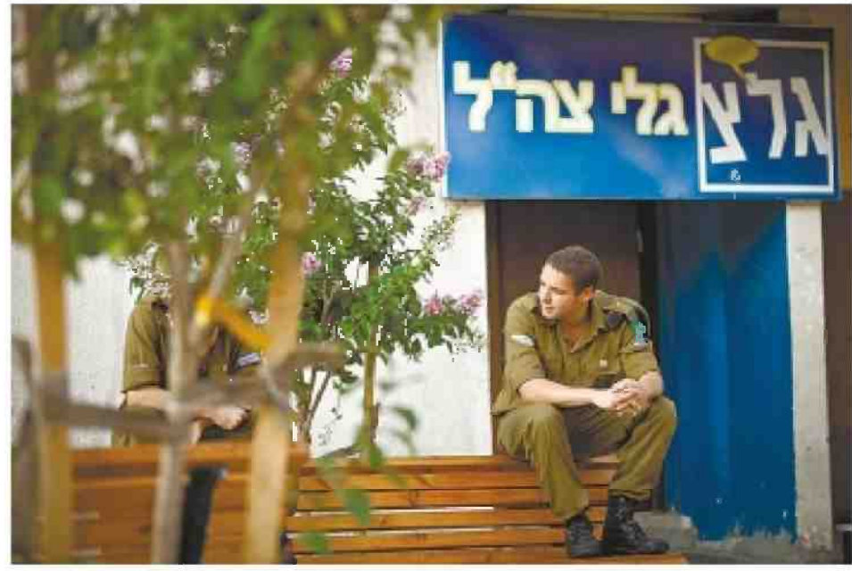
בניין גלי צה"ל. "חלק מהפיטורים היו החלטות לא מקצועיות"

משה שלונסקי: "אני שמח שדקל בתחנה. הוא בחור הגון, מקצועי, הוא בא לעבוד - והוא איש גלי צה"ל. הוא גם מחובר טוב פוליטית, וזה חשוב. גלי צה"ל וגלגלצ מוכיחות את עצמן יותר מתמיד מבחינת המענה לעניין החדשותי"