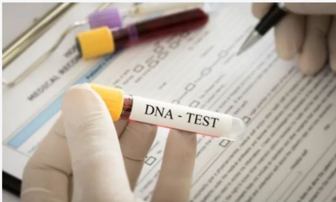
בדיקת DNA, אילוסטרציה

"בשנים האחרונות אני יותר ויותר עוסק בעזרה לאנשים באיתור משפחות ביולוגיות", אומר גידי פורז מ"קו הדורות - מחקר שורשים", העוסק בגנאלוגיה, חקר אילנות יוחסין, זה 15 שנים. כמו רבים מעמיתיו למקצוע, פורז נחשף בשנה האחרונה לאופן שבו בדיקות DNA לצורך גילוי שורשים, שהפכו פופולריות בשנים האחרונות בכלל, תפסו תאוצה ביתר שאת בתקופת הקורונה. "מספר הפניות מאוד גדל בשנה האחרונה כי לאנשים היה זמן", אומר פורז. "הם פתאום חיטטו בביידעם, אתרו תמונות ישנות, מסמכים, ורצו להבין את משמעותם, את הקשר המשפחתי. כל הפורומים הרלוונטיים היו מוצפים".