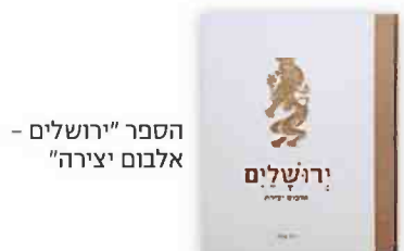
הספר "ירושלים - אלבום יצירה"

יוסף ריבלין 18, פתוח בימים ב'ה' מ'13:00 עד 19:00. כדאי לתאם בטלפון: 02-6222253.