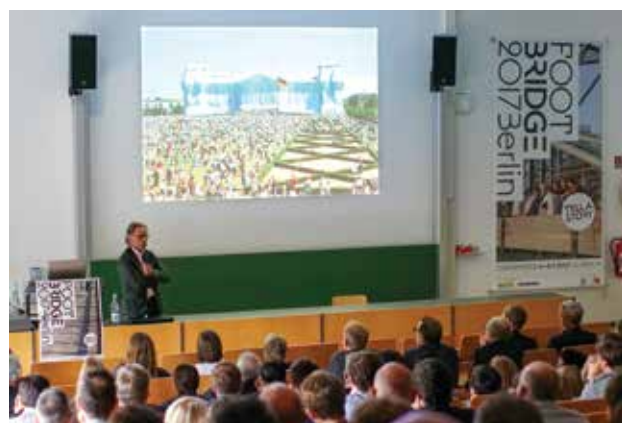
הרצאה מתוך הכנס

בגלל הצורה המורכבת, הגאומטריה המרחבית של הגשר לא מאפשרת סטנדרדיזציה מסוג כלשהו, ואין שני אלמנטים ראשיים זהים. חתך חגורות האגדים משתנה בהתאם למיקום בשדה, המרחקים בין הצירים אינם זהים, מפתחי קורות הרוחב משתנים לפי רוחב הגשר, ועובי חתכיהן בהתאם לכך, והגובה המשתנה של האגדים וזווית הנטייה יוצרים זוויות חיתוך שונות לכל קורה ואיתן פרטי חיבור בגאומטריה שונה. הגשר הפך להיות אחד הפרויקטים הראשונים שבהם משרד רוקח אשכנזי הפיק את כל תכניות הפלדה ישירות ממודל תלת-ממדי אשר בנו בתוכנה בטכנולוגיית BIM - TEKLA STRUCTURES. היום השיטה נפוצה יותר והיא משתלבת בצורה זו או אחרת בכל פרויקטי המשרד. לביצוע פרויקט גשר באר שבע לא הוצאו תכניות דו-ממדיות של מבנה הגשר בכלל. מודל הגשר, שקיבל את בסיסו מגאומטריית תכניות האדריכליות, עבר דרך תוכנות החישוב והפך להיות מודל מרחבי שלם שכלל בתוכו את כל האלמנטים הקונסטרוקטיביים, עד לרמה של פלדת הזיון ביסודות, וברגים, דיסקות ואומים במחברים. המודל המרחבי