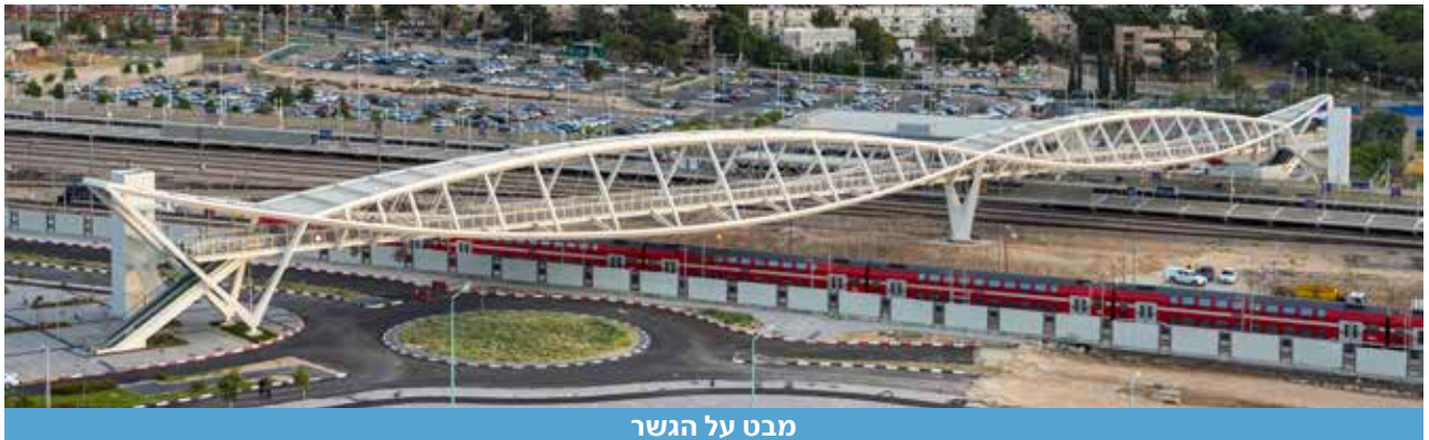
מבט על הגשר

בשעות הערב של יום חמישי, 18 ביוני 2015, הפסיקו את תנועת הרכבות לכיוון באר שבע, ובמבצע לילי הניפו את השדה הדרומי למקומו וחיברו אותו לנציבים. משקל השדה הדרומי כ-230 טון. במוצאי שבת הרכבות חזרו לעבוד כרגיל, וביום ראשון, 21 ביוני 2015, הניפו את השדה הצפוני (ללא הפסקת הרכבות) וחיברו אותו לנציבים. משקל השדה הצפוני כ-430 טון. לאחר חיבור השדות לנציבים, המשיכו בהשלמות הקונסטרוקטיביות, חיבור מעליות ודרגנועים, חשמל ותאורה, עבודות המדרך והמעקה, ובינואר 2016 נחנך ונפתח לציבור הגשר האייקוני שציפו לו התושבים נציגי העירייה כבר ביום פרסום התחרות.