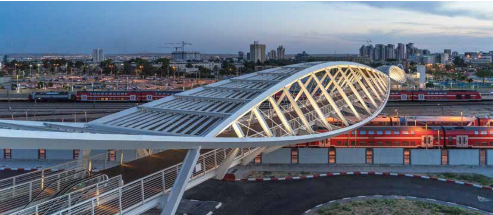
גשר באר שבע זכה במקום הראשון בעולם בתחרות היוקרתית "Footbridge Awards"