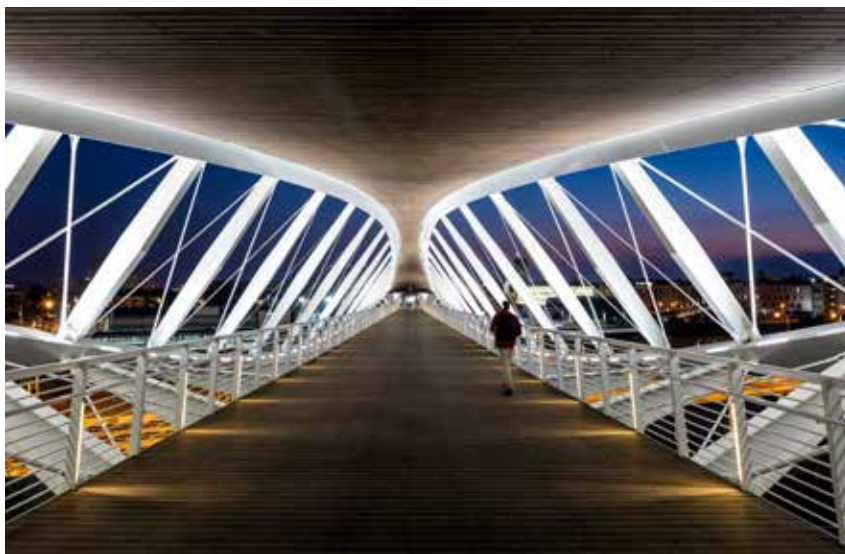
מבט בתוך הגשר

הכיוונים. שימוש באגד מסוג זה מתאים למפתחי הגשר ומאפשר את קבלת הכוחות ודפורמציות בד בבד עם שמירה על פרופורציה מפתח-גובה-חתך רצויה ואסתטית ללא פשרה במערכת המבנית.