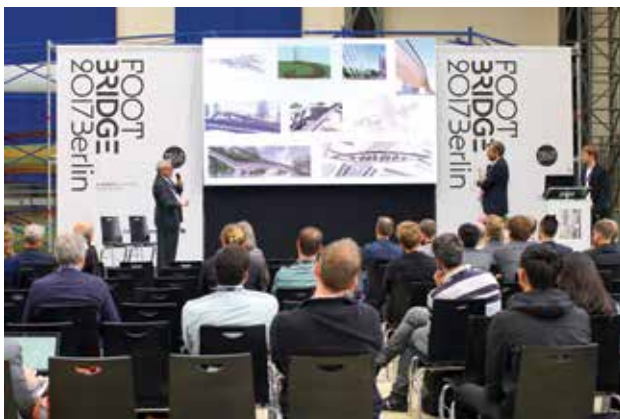
הרצאה מתוך הכנס שהתקיים בחודש ספטמבר בברלין

בשבוע הראשון של ספטמבר 2017 העיר ברלין אירחה את קהילת מתכנני הגשרים מהמובילים בעולם במסגרת הכנס המקצועי והיוקרתי שמתקיים ביוזמת המגזין הבינלאומי "Bridge" (BD&E). בכנס הייחודי בענף הבנייה שעוסק בגשרים להולכי רגל ואופניים