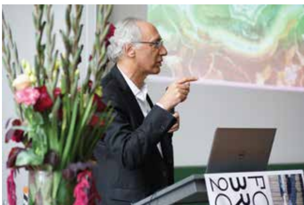
מתכנן הגשרים הצרפתי, מארק מימרם, בהרצאה במליאת הכנס

תנאי השטח ונתוני הגשר עצמם דרשו גיאומטריה מרשימה, שהביאה בסיס לעיצוב אדריכלי מרשים אף יותר, והצדיקה את הקונסטרוקציה הנחוצה לו. תנאי התחרות הגדירו גשר שהיה צריך לגשר מעל מסילות הרכבת הפעילות, התפעוליות והעתידות, שהביאו את אורך הגשר לכ-200 מ'. לגשר שתוכנן יש שני שדות, הגדול שבהם (הצפוני) במפתח 100 מ', והקטן (הדרומי) במפתח 70 מ', שביחד עם נציבי הקצה משלימים את אורך הגשר ל-200 מ'. כל אחד מהשדות מורכב מאגד פלדה, וגובה כל אגד משתנה באופן פרופורציונלי למפתח, בנקודות חיבור בקצוותם. גובה כל אגד עומד על מידה של כ-60 ס"מ, ומשם גדלים עד לגובה מרבי של 11 מ' ו-7.5 מ' באמצע המפתח הצפוני ודרומי בהתאמה. כל שדה מורכב ממערכת של אגדים נטויים שעוטפים את המדרך והוא יוצר מערכת מבנית מרחבית שתורמת לקשיחות הגשר. ביחד עם השתנות גובה האגד לאורך הגשר, ובדומה לה, זווית הנטייה של האגדים מצדי המדרך