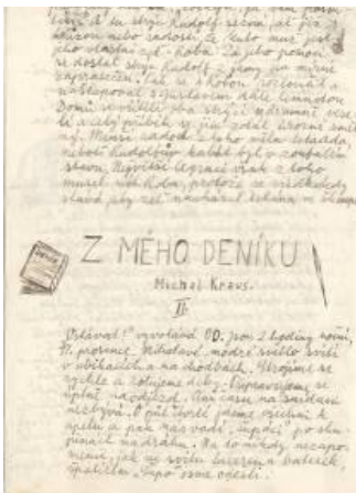
"מיומנ" מאת מישה קראוס