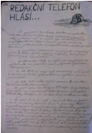
"טלפון המערכת מודיע" מאת איוון פולק