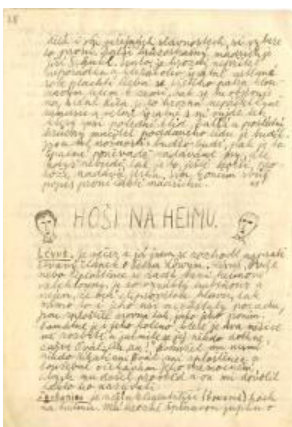
"הבנים בהים" מאת כותבים שונים