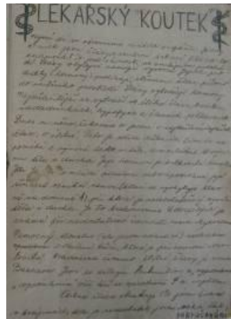
מדור הרפואה מאת "טומי"