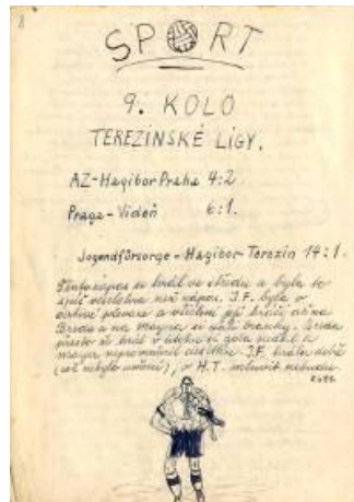
מדור ה"ספורט" מאת איוון פולק