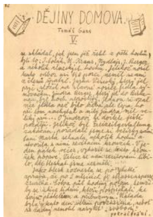
"תולדות המעון" מאת טומאש גאנס