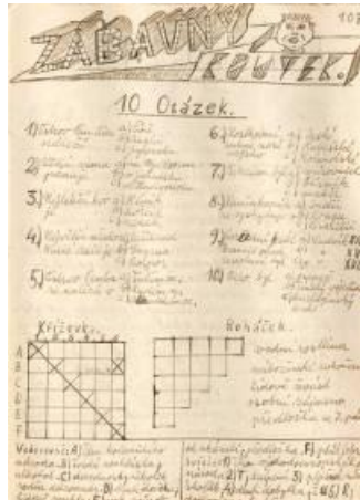
טעטעוון מאת איוון פולק