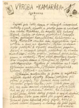
"אין נוצר קמרד" מאת איוון פולק