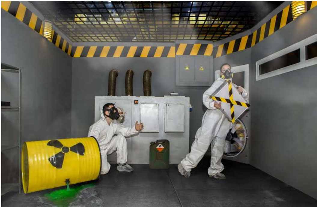
לבעלי מוגבלות מומלץ להתקשר לפני ההגעה ולוודא התאמה.

המחיר אכן נמצא בטווח שבין סרט למסעדה, ותלוי במספר המשתתפים ובמועד המשחק. אם תרצו לשחק בסוף שבוע, תצטרכו לשלם יותר. "עונש מוות" בתל אביב, למשל, עולה 160 שקל לזוג ו-220 לשלישיית שחקנים, ו"מועדון ציד" בבאר שבע, שבו תיפגשו בפסיכופתים שנהנים לענות, עולה 300 שקל לארבעה שחקנים. לא לבעלי לב חלש.