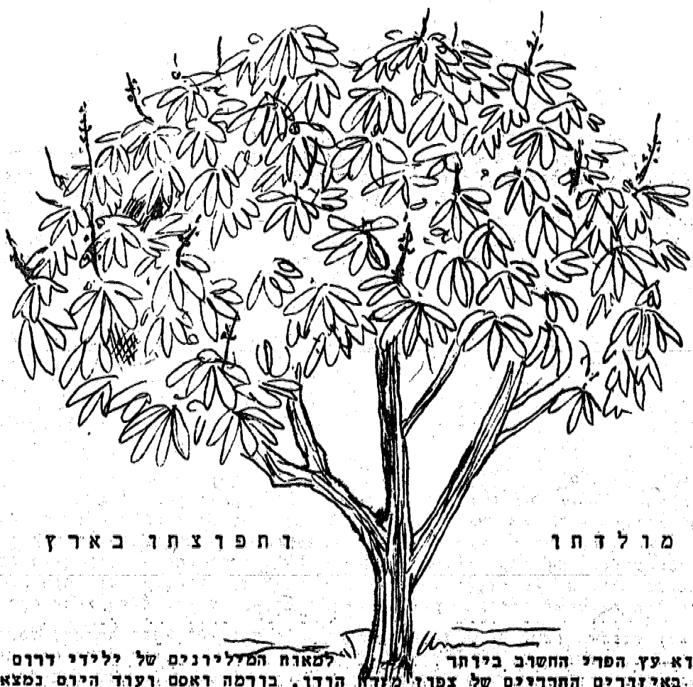
ו ח פ ו צ ת ו בארץ