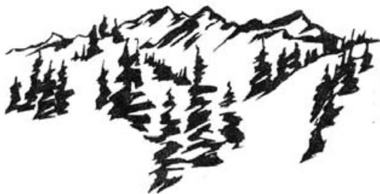
הלשטאטר, יצירה ייחודית שאין דומה לה.

כבר ביום השני הבנו שאנחנו פשוט בגן עדן לרכבי אופניים. בערך באותו סגנון רכבנו שלושה ימים נוספים באזור האגמים. סובבנו מספר אגמים גדולים, טיפסנו אל ראשי ההרים כשאנחנו מקללים את חיים, והשיא, אגם הלשטאטר שלחופו הכפר