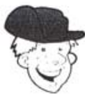
היו מתנדבים בגבעת חיים