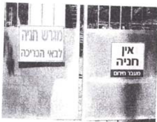
השער המזרחי של בריכת השחייה