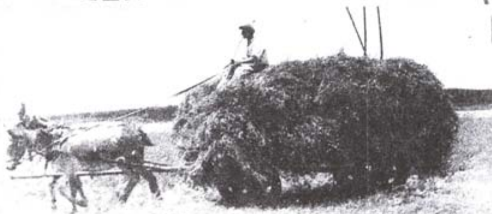
הפרידות ציפודקה חהבה

חבר! הרעב דופק בשערנו זכור ושמור כל פירור לחם ועל כל קורטוב של מצרך אוכל!