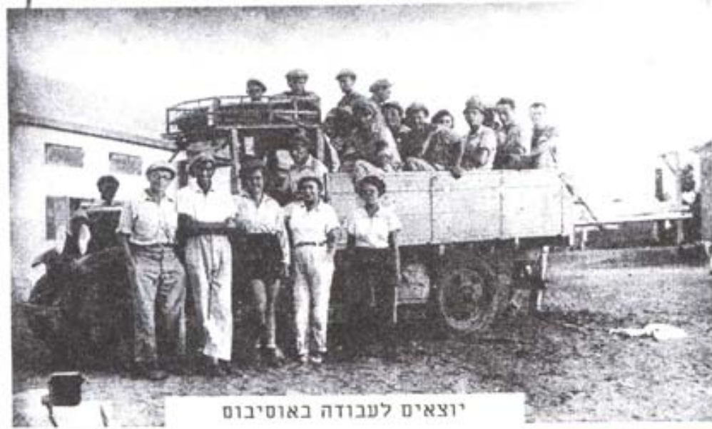
יוצאים לעבודה באוסיבוס