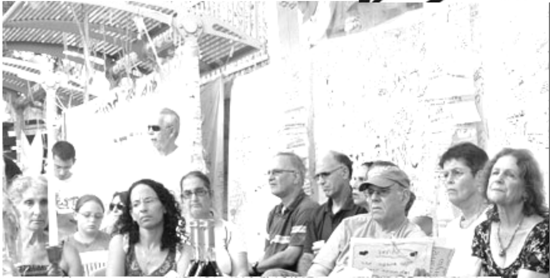
אוהל שליט