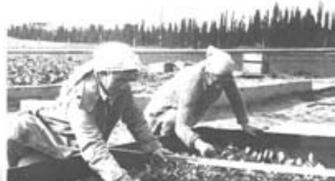
אסתר גיל ורות מאיר

את כל החברים, מה הוא גורל המדור "מן ההווי", המדור שרצה לרענן את היומן ולפרוץ את גדר האינפורמציה היבשה - באם ימשיך הקיבוץ בפעילותו הרבה בעיצוב דמות המדור.