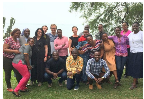
מכון ברקאי העביר קורס בטיפול בהשפעות טראומה ואבל לפסיכולוגים ועו"סים ברואנדה בקיץ 2018