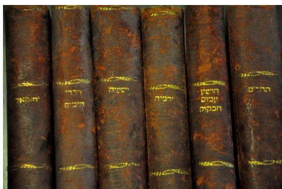
ששת הספרים של סבי

היא פתחה את העיניים עם חיוך קטן, "התקשור הסתיים" היא הכריזה, וכשראתה כמה שאני נסער המליצה לי על תרגיל נחמד לשחרור, לימים הבנתי שזה סוג של מדיטציה.