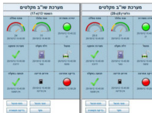
לוח מכוונים של מקלט